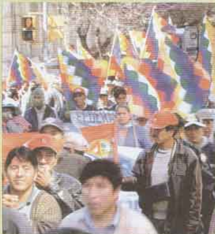
“Organizaciones uk runa jinalla sayaykuna, Pacto de Unidad propuestata jark'anapaq”