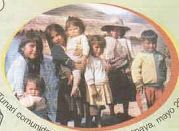
Tunari comunidadmanta, provincia Ayopaya, mayo 2007