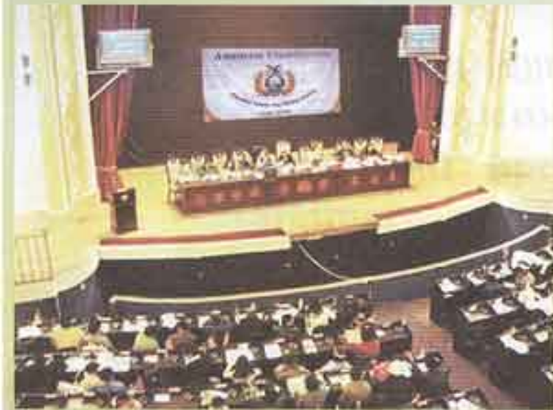
SUCRE: Kay chiqapi constituyentes llank'anku