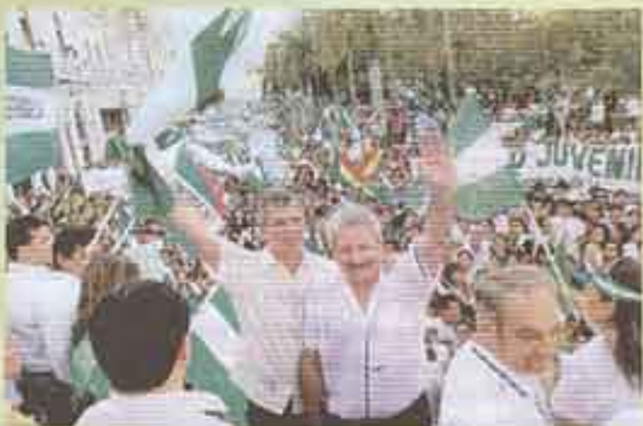
SANTA CRUZ: Derechamanta kaqkuna autonomía departamentalwan saruyta munachawanchik