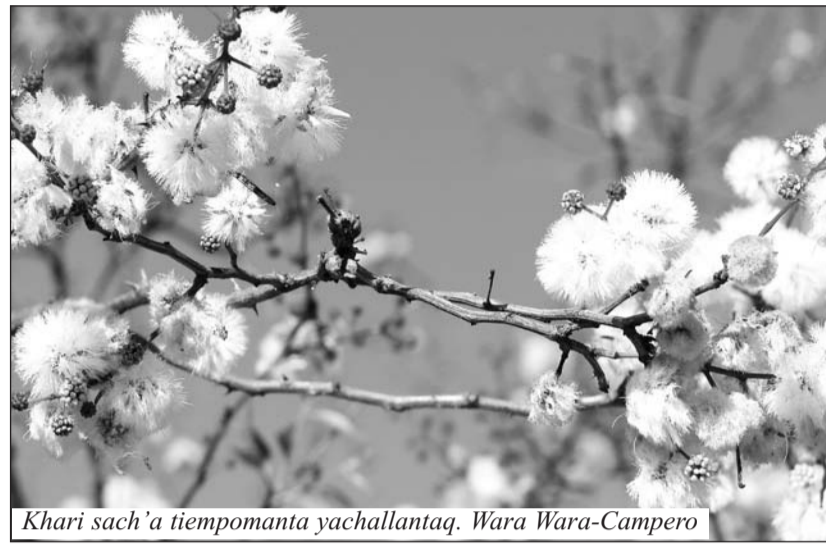
Khari sach’a tiempomanta yachallantaq. Wara Wara-Campero

“Jurukch’i qhipakama t’ikasan, allin wata kananpaq. Noviembrepipi, diciembrepipi tarpuykuna llusinqa, ñawpaq tarpuykuna aciertakunqa, qhipa tarpuykuna iskaypi kasan, paras normal kanqa kay wataqa, marzo killa chayta t’ipinqa paras. Sarawan, papawan kusa kanqa, cielopi sara phinas tiyan, chaypi yachani. Kay wata sara astawan puqunqa, nuqapis ñawpaq paraswan tarpusaq”.