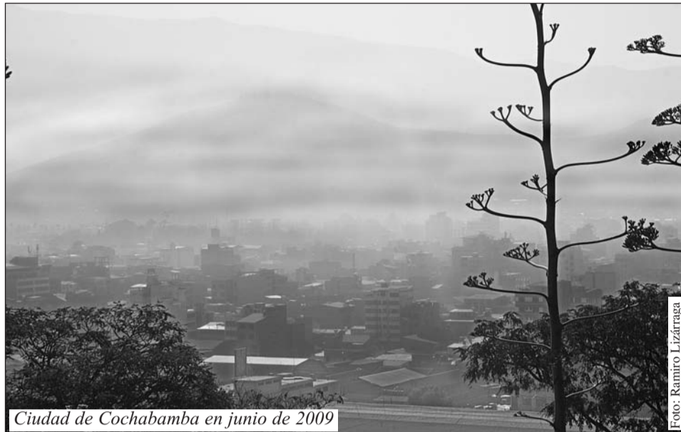
Ciudad de Cochabamba en junio de 2009