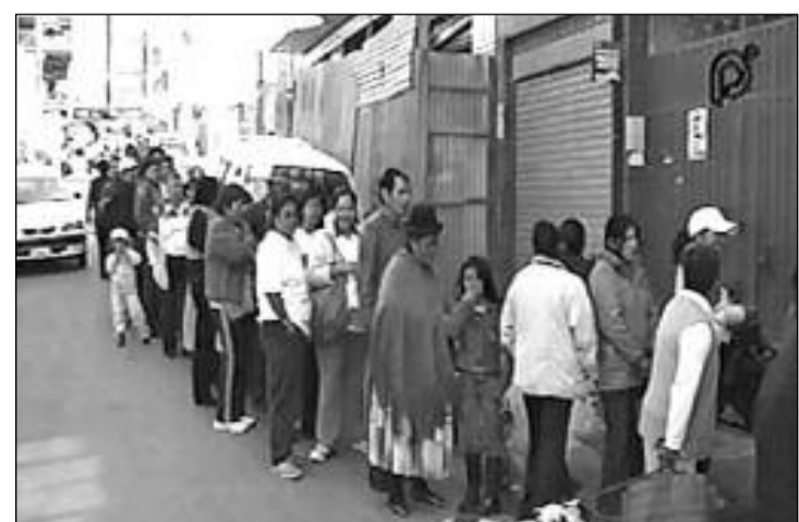
Largas filas por un kilo de azúcar. http://debates-politica.com/5362

En cambio para los campesinos y pueblos indígenas originarios, el gobierno no dictó ninguna medida inmediata, de apoyo a la producción. (plataformaenergetica.org 10/01/2011)